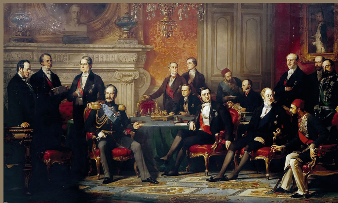
Eduard Dubufe, Kongres w Paryżu , domena publiczna

Bardzo osłabiona zmaganiem wojennymi Rosja czuła się również upokorzona podpisaniem traktatu pokojowego w Paryżu w 1856 r.