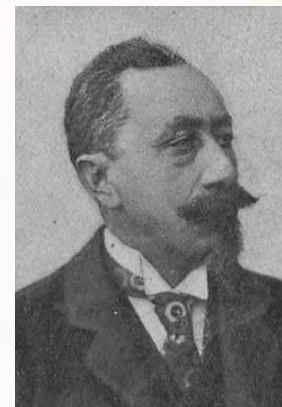
Edmund Klemensiewicz, domena publiczna