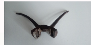
Forma do odlewania kul karabinowych ze zbiorów Muzeum Ziemi Miechowskiej

Wszystkie oddziały tworzone w Ojcowie były niedostatecznie umundurowane i uzbrojone, broń palna była często przestarzała i brakowało do niej amunicji.