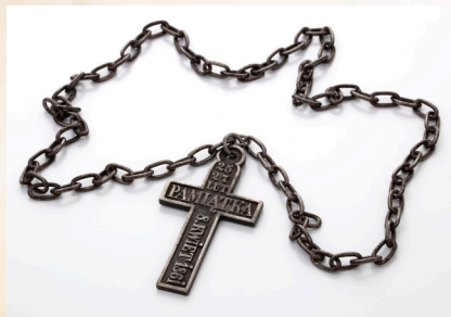
Żelazny krzyż na łańcuchu, z napisem: 25/27Lut/PAMIĄTKA/8KWIEŃ1861, na stronie odwrotnej gałązka laurowa w koronie cierniowej i napis: WARSZAWA, 1861r., ze zbiorów Muzeum Ziemi Miechowskiej