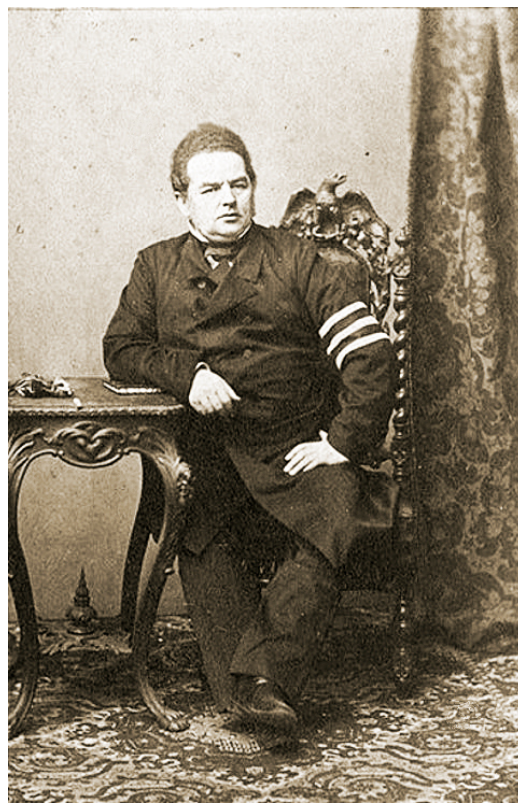
Leopold Kronenberg, 1861 r.

Biali , podobnie jak czerwoni byli organizacją polityczną, która powstała w 1861 r. Głosili hasła pracy organicznej i nie byli zwolennikami powstania zbrojnego , a przynajmniej nie od razu chcieli wojny z Rosją. Sprzeciwiali się również zbyt ugodowej