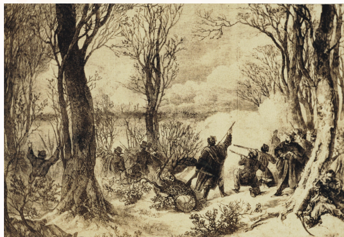
Powstanie Styczniowe

W przygotowaniach szczególne znaczenie zyskał Płock, który po wyzwoleniu miał pełnić rolę siedziby Rządu Narodowego. Tam udała się młodzież, która od nocy branki ukrywała się w lasach - zgrupowana w oddziale „Dzieci Warszawskie”, jednakże plan zajęcia miasta nie powiódł się. Nie udało się też zdobyć Szydłowca, Suchedniowa i Bodzentyna, co zmusiło naczelnika wojennego województwa sandomierskiego Mariana Langiewicza do odwrotu na Wąchock, gdzie wyznaczono punkt zborny dla sił powstańczych z podległego mu terenu.