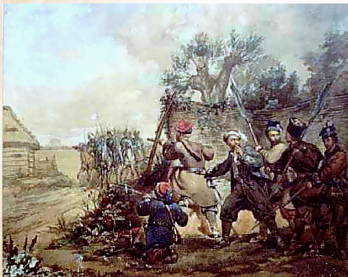
Walery Eljasz-Radzikowski, Bitwa pod Miechowem , domena publiczna

W trakcie pobytu powstańców w Czaplach, rosyjska załoga stacjonująca w Miechowie została poinformowana o tym fakcie, co dało czas Rosjanom na przygotowanie się do starcia . Spośród przebywających w mieście oddziałów kompania pułku smoleńskiego zajęła cmentarz i tereny wokół niego , służba pomocnicza 7 batalionu utworzyła barykady przy wylocie ul. Wolbromskiej w kierunku zachodnim, a część zabarykadowała się w klasztorze . Druga rota pułku smoleńskiego i spieszni objeszczycy oczekiwali na nadejście oddziałów powstańczych w rynku . Dodatkowo wyborowi strzelcy zajęli dogodne pozycje , w niektórych domach w rynku i na bocznych ulicach miasta.