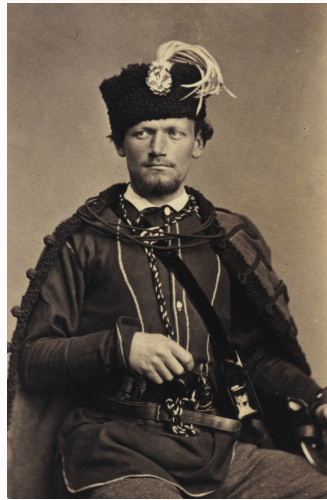
Apolinary Kurowski

Około 25 stycznia 1863r. w podkrakowskim Ojcowie , w dolinie rzeki Prądnik przystąpiono do tworzenia obozu powstańczego. Jego organizatorem został pułkownik Apolinary Kurowski , któremu powierzono również funkcję naczelnika cywilnego i wojskowego województwa krakowskiego.