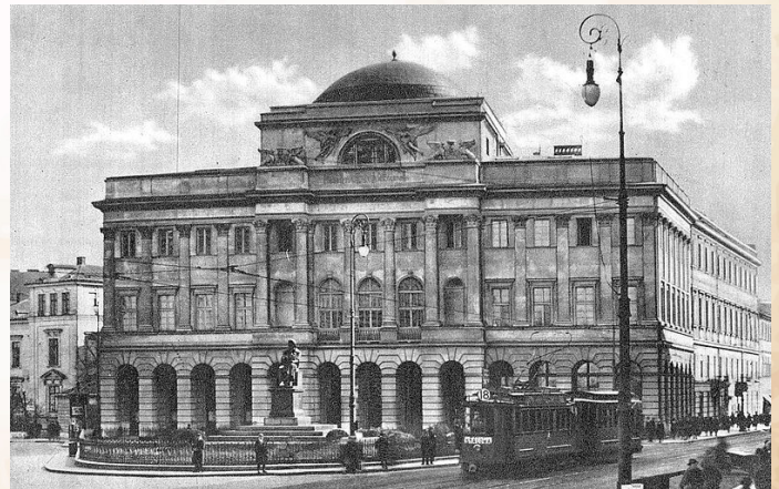
Pałac Staszica przed 1939 r., w latach 1857-1862 siedziba Akademii Medyko-Chirurgicznej

W rok po wizycie cara w Królestwie Polskim – w 1857 r. utworzono w Warszawie Akademię Medyko-Chirurgiczną . Zezwolono na założenie Towarzystwa Rolniczego , które stało się ważną organizacją obejmującą najbardziej wpływową warstwę społeczeństwa polskiego. Do niego w 1859 r. zwróciły się władze rosyjskie o przygotowanie projektu reformy rolnej.