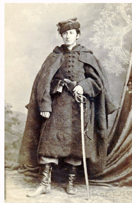
Emanuel Moszyński, domena publiczna

Po krótkiej, acz krwawej walce na bagnety udało się zdobyć cmentarz i będący w budowie kościółek św. Barbary, po czym ruszono uliczkami w kierunku rynku.