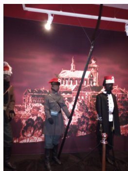
Rekonstrukcja stroju kosyniera na wystawie w Muzeum Ziemi Miechowskiej

Jazda nie osiągnęła dużej liczebności , powstańcy nie posiadali dostatecznej ilości koni ćwiczonych do walki, brakowało siodła oraz wyszkolonych jeźdźców. Użyteczność jazdy podczas przemieszczania się terenami zalesionymi także była o wiele mniejsza niż piechoty.