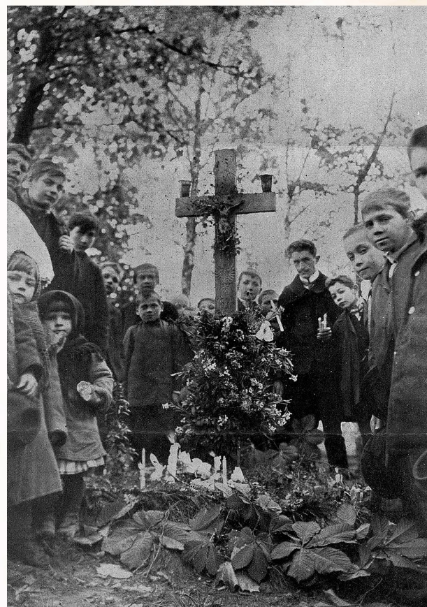
Mogila poległych w bitwie miechowskiej, 1914-1923, domena publiczna

Bitwa o Miechów obnażyła braki w przygotowaniu oddziałów powstańczych, nieudolność dowodzenia, niedostatki wyposażenia w broń i amunicję. Jednocześnie ukazała wielki patriotyzm i miłość do Ojczyzny powstańców, wśród których przeważała młodzież, chcąca za wszelką cenę wywalczyć wolną Polskę. Wstąpili do ojcowskiego oddziału dobrowolnie, nie przymuszani przez nikogo, przekonani o konieczności walki z zaborcą oraz będąc świadomi ryzyka, jakie niesie to ze sobą: kalectwa, więzienia, zesłania lub śmierci. Formacja powstańcza tworzona z ogromnym wysiłkiem, z którą wiązano wielkie nadzieje przestała istnieć w ciągu dwóch godzin. Tym samym utracono szansę i nadzieję na rozbudowę oddziału, który mógł zmienić losy powstania w województwie krakowskim.