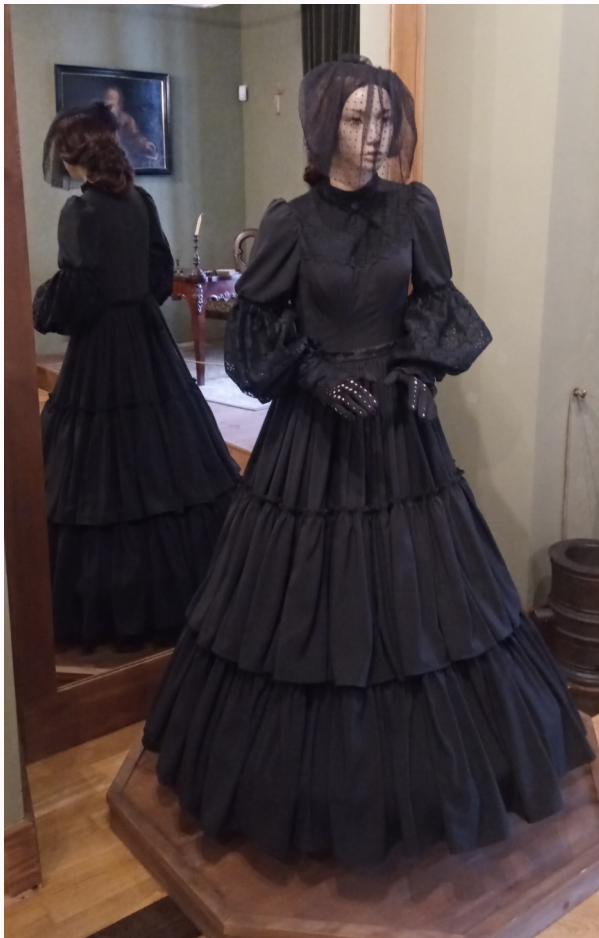
Rekonstrukcja stroju żałobnego na wystawie w Muzeum Ziemi Miechowskiej

W okresie zaborów, żałoba narodowa była formą protestu przeciwko działaniom rosyjskim - krwawemu tłumieniu manifestacji patriotycznych. Wprowadzony przez Rosjan zakaz wkładania czarnych strojów zadziałał zupełnie odwrotnie. W Warszawie, a potem na terenie całego Królestwa, kobiety powszechnie założyły czarne suknie, demonstracyjnie odchodząc od kolorowych dodatków.