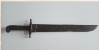
Tasak austriacki, ze zbiorów Muzeum Ziemi Miechowskiej

Jazda nie osiągnęła dużej liczebności , powstańcy nie posiadali dostatecznej ilości koni ćwiczonych do walki, brakowało siodła oraz wyszkolonych jeźdźców. Użyteczność jazdy podczas przemieszczania się terenami zalesionymi także była o wiele mniejsza niż piechoty.