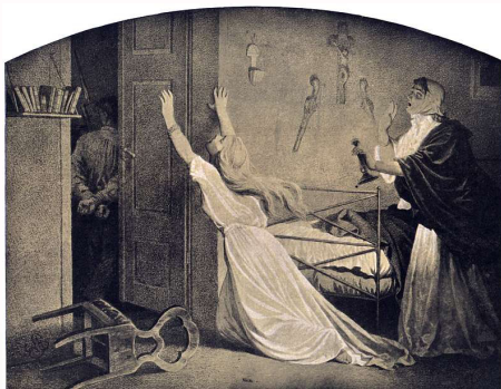
Artur Grottger, Branka (cykl Polonia), domena publiczna

Po utworzeniu Komitetu Miejskiego organizacja Czerwonych zaczęła się rozrastać, a powstanie Komitetu Centralnego Narodowego przyspieszyło