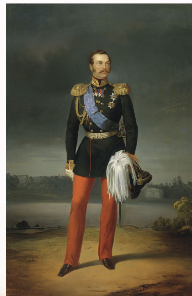
Yegor Botkin, Portret Aleksandra II , domena publiczna

Rządzący od 1855 roku car Aleksander II , który objął władzę po śmierci swego ojca Mikołaja I, zdawał sobie sprawę z konieczności przeprowadzenia reform, niezbędnych do modernizacji i naprawy rozległego państwa, którego słabość i zacofanie w pełni uwidoczniła zakończona klęską wojna.