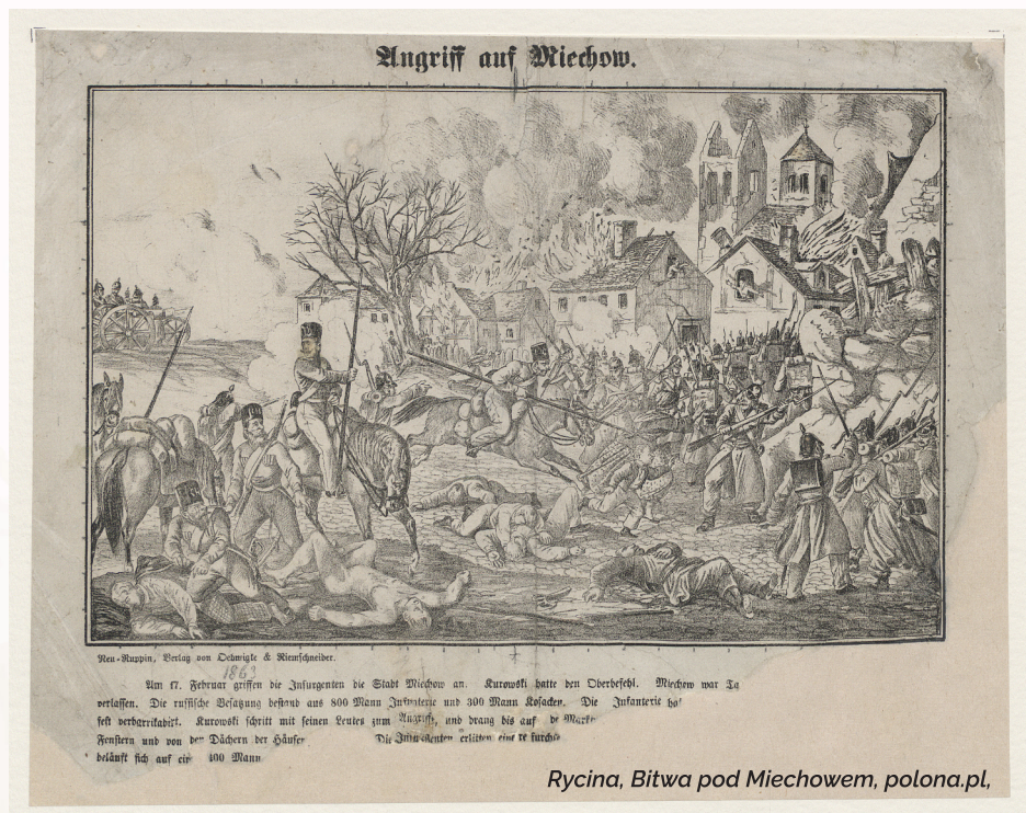
Rycina, Bitwa pod Miechowem

Oddział, w którym dowództwo pokładało tak wielkie nadzieje, został rozbity a największe straty odniosły formacje, w których walczyła młodzież krakowska oraz sformowani z pieczołowitością Żuawi Śmierci. Klęska osłabiła morale pozostałych oraz odebrała im wiarę w sukces powstania już w początkowym jego stadium. Dotkliwa porażka ochotników Kurowskiego w bitwie miechowskiej oraz skutki tego starcia, jakimi była rzeź mieszkańców miasta oraz spalenie Miechowa , wstrząsnęły opinią publiczną Królestwa