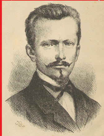
Jarosław Dąbrowski

Czerwoni byli organizacją polityczną, która ostatecznie ukształtowała się pod koniec 1861 r. Jako bardzo radykalni, uważali, że niepodległość można uzyskać tylko na drodze walki zbrojnej, za bardzo ważny postulat uważali uwłaszczenie chłopów . W październiku 1861 r. Czerwoni utworzyli Komitet Miejski, który w połowie 1862 r. przekształcił się w Komitet Centralny Narodowy, uznający się za