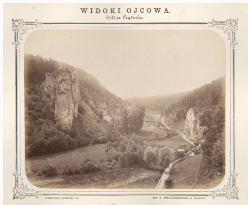
Widoki Ojcowa. Dolina Prądnika

Ojców leży w miejscu, które było dogodne dla powstańców - blisko granicy z Galicją, około 6 godzin marszu od Krakowa, z którego można było potajemnie przewozić do obozu broń, amunicję czy leki. Wybrano Ojców również ze względu na to, że w jego bliskiej odległości nie było wówczas miejscowości, w których stacjonowały większe siły rosyjskie. Dawało to organizującym się ochotnikom szansę w miarę spokojnego przygotowania się do walki.