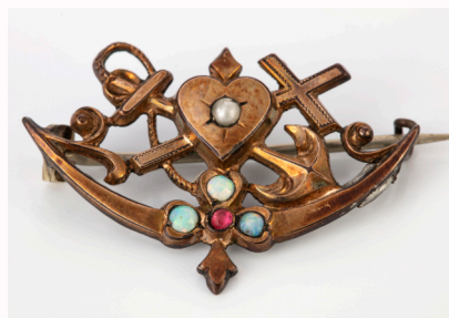
Broszka z sercem, kotwicą i krzyżem (symbole Wiary, Nadziei i Miłości), pamiątka po rodzinie Lepiarczyków, II poł. XIX w., ze zbiorów Włodzimierza Barczyńskiego

ne na czarno, które zawiązywały na szyi w supęt symbolizujący pętlę na szubienicy.