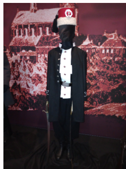
Rekonstrukcja stroju Żuawa Śmierci na wystawie w Muzeum Ziemi Miechowskiej

Stąd wiele niepowodzeń i nieudanych szarż powstańczych podczas bitew z wyszkolonymi żołnierzami rosyjskimi. Kawalerzyści uzbrojeni byli w broń zarówno białą, jak i palną. Z braku szabel korzystali z ciężkich saperskich tasaków austriackich, zdobywanych w Galicji i przemycanych do Królestwa.