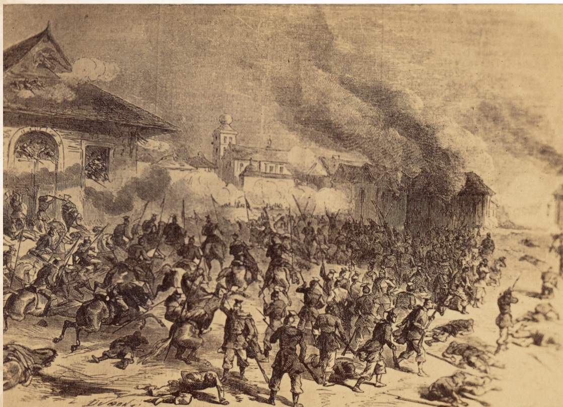
Atak powstańców na Miechów, rycina Jędrzej Brydak

Apolinary Kurowski źle zaplanował atak na Miechów, lecz większym jego błędem jest brak zdecydowanej inicjatywy w celu ocalenia resztek oddziału ojcowskiego.