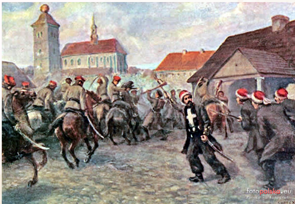
Jan Ludwik Sobecki, Napad na Miechów