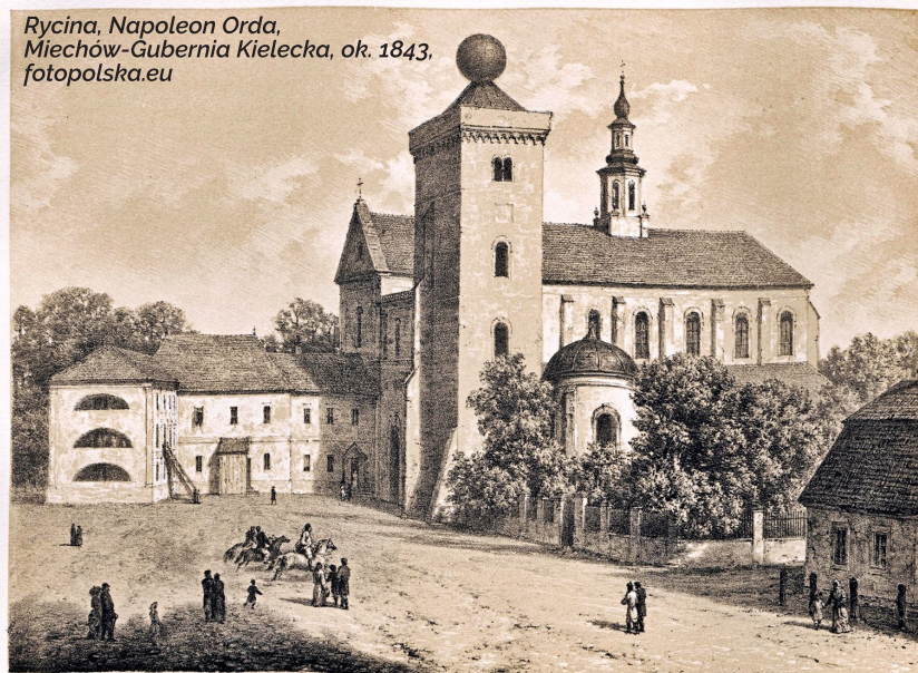
Rycina, Napoleon Orda, Miechów-Gubernia Kielecka, ok. 1843