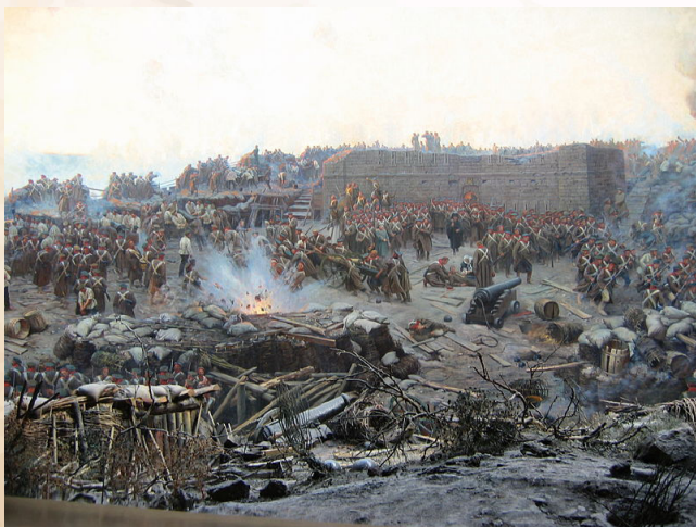
Franz Roubaud, Oblężenie Sewastopola , domena publiczna

Wybuch Powstania Styczniowego 1863 r. ma swoje głębsze korzenie w wydarzeniach, jakie zachodziły w Imperium Rosyjskim od lat 50. XIX w. Rosja carska, była niechcianym domem dla wielu milionów Polaków. W Królestwie Polskim i na ziemiach wcielonych do Rosji żyło i mieszkało najwięcej Polaków ze wszystkich zaborów. Imperium carskie tamtego okresu uważało się za potęgę europejską i taką też prowadziło politykę. W 1853 r. doszło do wybuchu wojny pomiędzy Rosją a Turcją, która przeszła do historii pod nazwą wojny krymskiej. Początkowo miała ona charakter lokalny, lecz przerodziła się w pierwszy od czasów napoleońskich konflikt zbrojny mocarstw europejskich. Po początkowych sukcesach Rosjan w walce na Morzu Czarnym, do wojny przyłączyły się militarne potęgi europejskie: Francja i Wielka Brytania, które wsparły Turcję, gdyż były przeciwne wzmocnieniu Imperium rosyjskiego. Tak ukształtowana koalicja państw antyrosyjskich, doprowadziła do jej ostatecznej klęski w wojnie krymskiej.