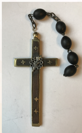
Drewniany krzyż oprawiony w mosiądz, ze srebrną palmą męczeńską obwiedzioną koroną cierniową i pięcioma krzyżykami (symbole ran Chrystusa), II poł. XIX w.; ze zbiorów Włodzimierza Barczyńskiego