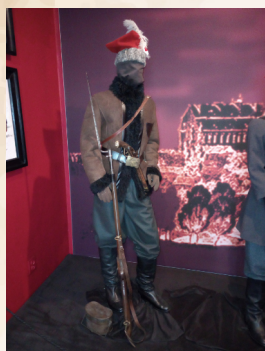
Rekonstrukcja stroju strzelca na wystawie w Muzeum Ziemi Miechowskiej

Największą część wojska powstańczego stanowiła piechota i na niej spoczywał główny ciężar walki. Miała ona możliwość maskowania i ukrywania na otwartej przestrzeni oraz przemieszczania się w trudnym leśnym terenie. Piechotę dzielono na strzelców wyposażonych w karabiny i strzelby starszego typu oraz kosynierów uzbrojonych w kosy przekuwane na sztorc . Czasami w miejscu mocowania ostrza do drzewca instalowano haki do ściągania jeźdźców z koni. Zabezpieczano również drzewce - owijano je drutem lub okuwano blaszkami w celu uniemożliwienia przecięcia drzewca szablą.